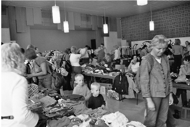
„Startschuss“ um 15.00 Uhr: Die ersten Käufer haben noch die größte Auswahl beim Kindersachenflohmarkt im Kirchsaal der Andreaskirche am 23. September 2005

der Kinder stattfinden konnte. Rund € 400 konnten mit dem Verkauf von Kuchen, durch die Standgebühren und Spenden eingenommen werden, die natürlich wieder den Kindern in unserer Kita zugute kommen sollen. An dieser Stelle ein herzliches Dankeschön an alle Helfer, Verkäufer und Schnäppchenjäger.